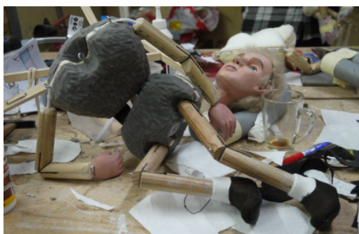
> Fabrication d'une des marionnettes de Mars 500 .

Le plasticien Bertrand Dezoteux est en résidence hors les murs à l'Observatoire de l'Espace pour son projet Mars 500 , inspiré de l'expérience scientifique durant laquelle six individus sont restés confinés pendant 520 jours à bord d'un prototype d'habitable spatial afin de simuler les conditions d'un voyage sur Mars. L'artiste fabrique une maquette réduite mais réaliste de cet habitacle pour y faire évoluer des marionnettes auxquelles il fera reproduire certaines des expériences et situations vécues par les volontaires lors de la mission. Il s'attache à montrer ainsi que la recherche en science peut fournir à la recherche en art de nouvelles hypothèses de travail.